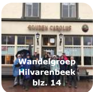
Wandelgroep Hilvarenbeek blz. 14