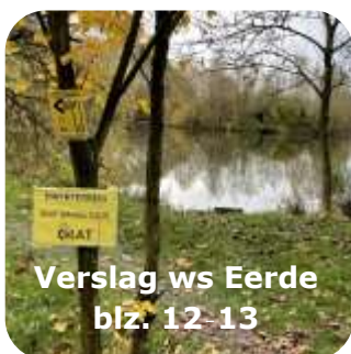
Verslag ws Eerde blz. 12-13