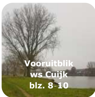
Vooruitblik ws Cuijk blz. 8-10