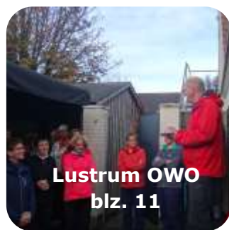
Lustrum OWO blz. 11